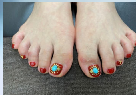
赤×ターコイズがポイントです!! ¥6500(税別)